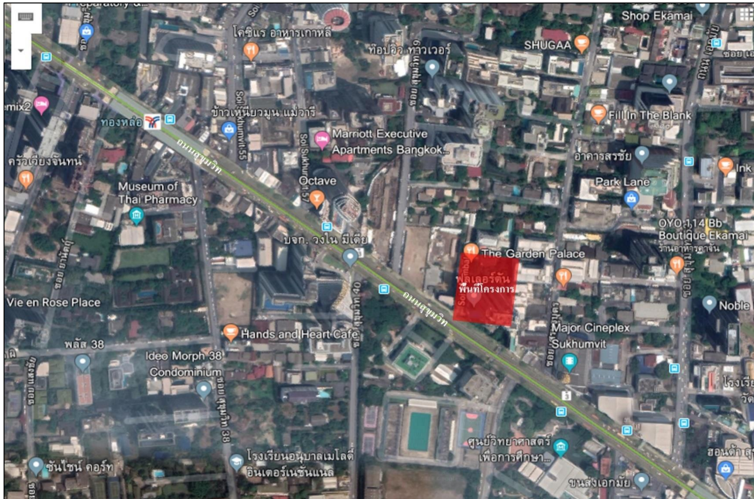
รูปที่ 2.1-1 ที่ตั้งโครงการโดยสังเขป